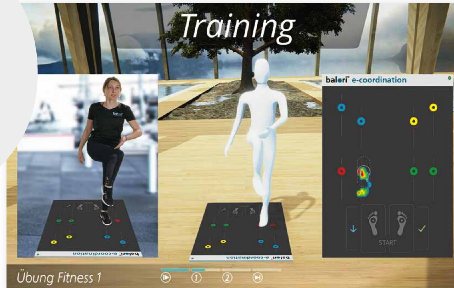
Übung Fitness 1

„Erleben Sie eine zeitgemäße betriebliche Gesundheitsförderung mit moderner Technik.“